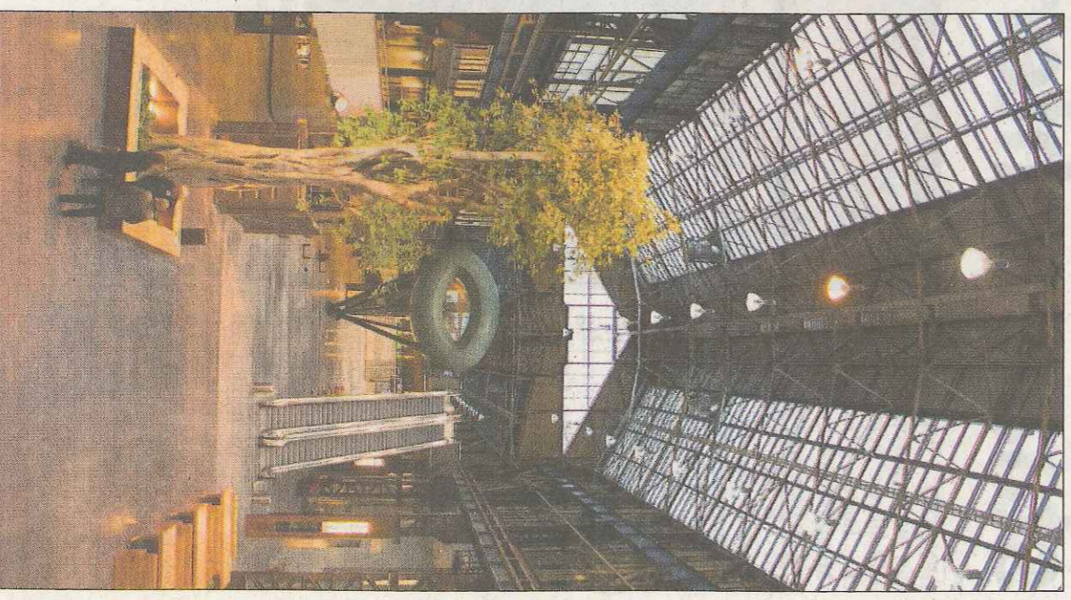
Als je via de hoofdingang binnenkomt, sta je in de central hal, oftewel de voormalige gietertij van Stork.

In de nok van het gebouw bevinden zich zogeheten 'zonnescloostenen'. Hiermee wordt op natuurlijke wijze de temperatuur en ventilatie in het gebouw geregeld. De schoorstenen zijn van glas. Als de zon er op schijnt, wordt de lucht binnenin verwarmd. De warmer wordende lucht komt in beweging, waardoor lucht van buiten wordt aangezogen. De aangezogen lucht is in de zomer koeler en in de winter warmer dan de temperatuur van de buitenlucht. Het bijzondere is dat dit systeem geen energie gebruikt.