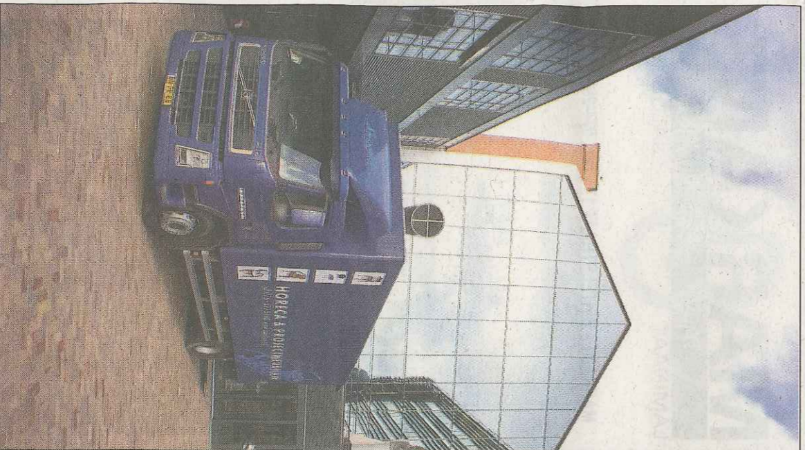
Verhuizers en leveranciers rijden momenteel nog af en aan. Pas na de zomer van 2009 is elke ruimte bezet en zijn alle klassen welkom.