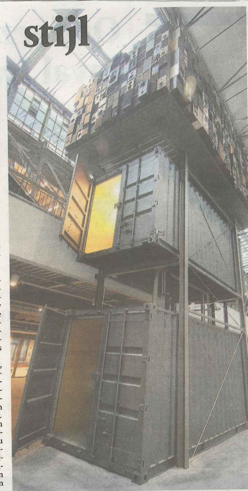
Geen containerhal, maar het ROC van Twente.

■ en zijn er in de school filialen van de Rabobank (met een pinautomaat), het uitzendbureau Randstad, de boekhandel Broekhuis en de verkeersschool Brookhuis. Bovendien zit er een kinderdagverblijf gevestigd, al dan niet voor kinderen van ROC-gangers.